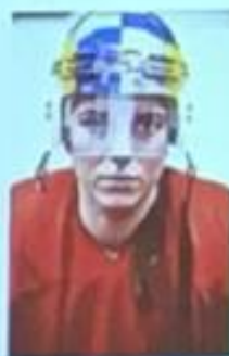
Teaming HILARY KNIGHT (34) Red Bull Athlete (H)