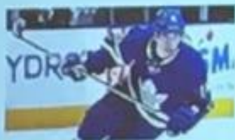
Teaming MITCH WARNER (77) Red Bull Athlete (H)