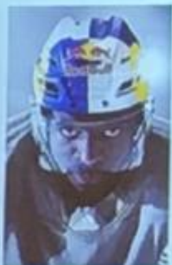
Teaming PK SUBBAN (34) Red Bull Athlete (H)