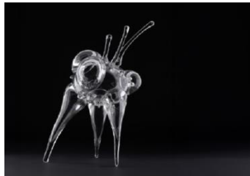
Oficiální maskot René – exponaut z Česka